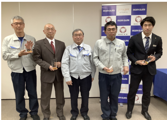
皆様お疲れ様でした！