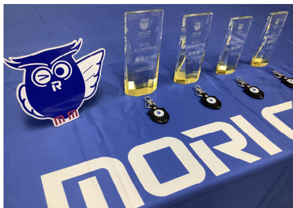
発表者にはトロフィーと記念品が贈られました！