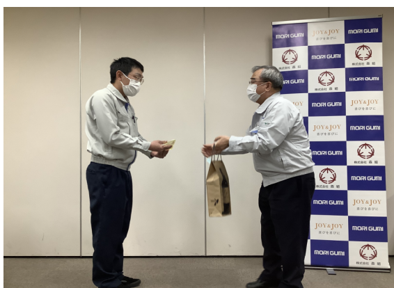
最優秀賞 前田スタッフ