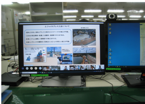
今年もオンラインで開催